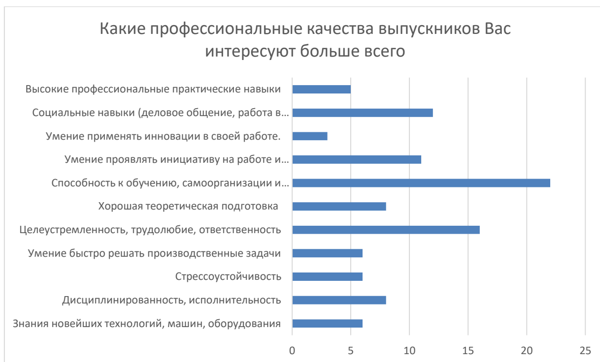
Рисунок 1 – Результаты ответов представителей работодателей на группу вопросов, связанных формируемыми профессиональными качествами выпускников